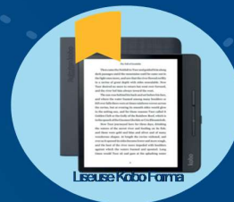
Liseuse Kobo Forma