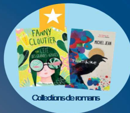
Collections de romans