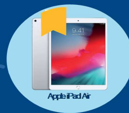
Apple iPad Air